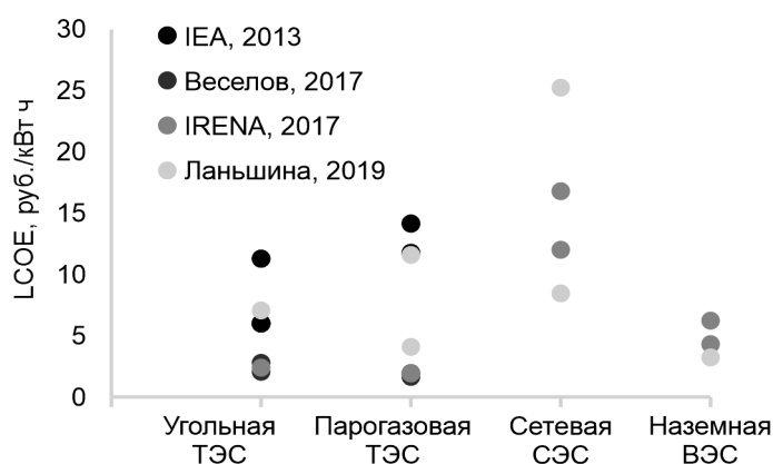
Рис. 2. Оценки затрат производства электроэнергии в России

Другой подход базируется на расчете нормированной (приведенной) стоимости электроэнергии (Levelized Cost of Energy – LCOE), которая показывает капитальные и операционные издержки производства киловатт-часа в постоянных (реальных) ценах за весь срок службы электростанции. Этот показатель используют не только исследователи, но и – в качестве бенчмаркинга – крупные аналитические агентства, например, консалтинговая компания Lazard и Международное энергетическое агентство по возобновляемой энергетике (IRENA). Несмотря на надежность данных о капитальных и операционных издержках, наблюдается значительный разброс оценок как между разными источниками энергии, так и для одного типа электростанций, параметры работы которых чувствительны к локализации энергообъектов (рис. 2).